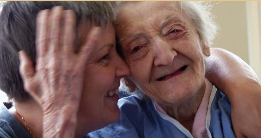
Un guide pour les proches

C E GUIDE S'ADRESSE AUX PROCHES D'UNE PERSONNE DONT L'ÉTAT DE SANTÉ S'EST CONSIDÉRABLEMENT DÉTÉRIORÉ À CAUSE D'UNE MALADIE D'ALZHEIMER OU D'UNE AUTRE MALADIE DÉGÉNÉRATIVE DU CERVEAU (SÉQUELLES D'ACCIDENTS VASCULAIRES CÉRÉBRAUX, MALADIE DE PARKINSON OU CERTAINES FORMES DE SCLÉROSE EN PLAQUES PAR EXEMPLE).