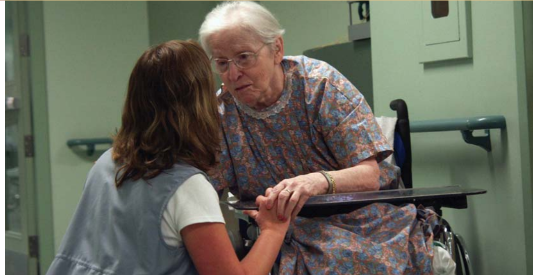
Un guide pour les proches